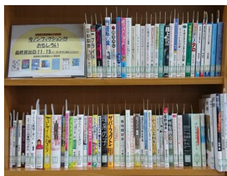
テーマ: 「今ノンフィクションが面白い」