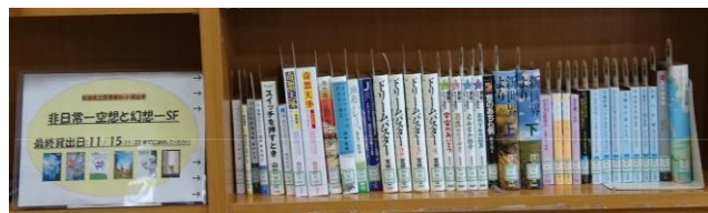
テーマ: 「非日常 - 空想と幻想-SF」

本館では、県立図書館より、様々なテーマの セット貸出図書 をお借りして配架しています。北高の図書と同様にお貸しできますし、御返却も当館です。現在配架中のテーマは、以下の2つです。合わせて75冊、11/15迄の予定です。