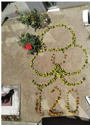
5/20 花壇に植えた マリーゴールド

新型コロナウイルス感染 防止のため、一般公開は 行いませんでしたが、 各クラス・部・同好会等 がそれぞれ工夫をこらし て展示・発表を行いました。 大いに盛り上がり、 素晴らしい北高祭でし た！！